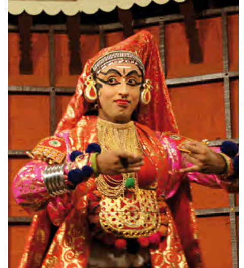
Kathakali – klassisches indisches Tanzdrama

Das Käte Hamburger Kolleg an der Freien Universität Berlin eröffnet und bearbeitet ein neues Forschungsfeld: Verflechtungen von Theaterkulturen im Zeichen von Geschichte und Gegenwart der Globalisierung. Solche Verflechtungen lassen sich bis zum ausgehenden 19. Jahrhundert zurückverfolgen. Sie treten heute besonders augenfällig in der internationalen Zusammensetzung von Ensembles, in der Kollaboration von Künstlerinnen und