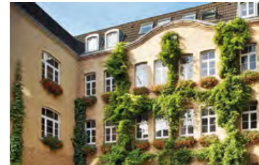
Morphomata. Genese, Dynamik und Medialität kultureller Figurationen

Gebilde – Sinnbilder, Figuren, Kunstwerke – analysieren sie die unterschiedlichen Formensprachen des Figurativen und untersuchen, wie sich gemeinsame oder unterschiedliche Ausformungen kultureller Sinnstiftung entwickeln.