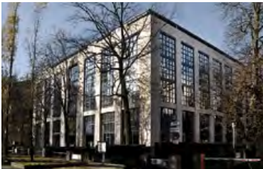
Rachel Carson Center Umwelt und Gesellschaft

Wissenschaftlerinnen und Wissenschaftler, die das Verhältnis von Natur und Kultur erforschen – ausgehend von einer historisch-genetischen Perspektive, über Disziplinengrenzen hinweg sowie in unterschiedlichen zeitlichen und geografischen Kontexten.