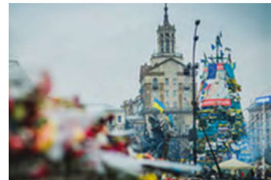
Protest in Kiev

Das Käte Hamburger Kolleg „Europas Osten im 20. Jahrhundert. Historische Erfahrungen im Vergleich“ erforscht zentrale Probleme ostmitteleuropäischer Zeitgeschichte in transnationaler Perspektive. Das Kolleg fragt u. a. nach den Ursprüngen und der Funktion politischer Gewalt im östlichen Europa, nach den Begegnungen der Staaten mit ihren Bürgerinnen und Bürgern und nach den Aufbrüchen zur Demokratie. Weitere Schwerpunkte sind die gesellschaftlichen Transformationen und die dahinter liegenden Vorstellungen von Modernität.