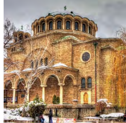
Christlich-orthodoxe Kirche in Sofia

Das Käte Hamburger Kolleg „Dynamiken der Religionsgeschichte“ erforscht die Entstehung und Entwicklung der großen religiösen Traditionen durch die Begegnung mit und in Konfrontation zueinander. Im Fokus stehen Dynamiken der Entstehung und Verbreitung von Religionen, die wechselseitigen Durchdringungen religiöser Traditionen und deren Verdichtungen in den komplexen Gebilden der sogenannten