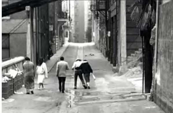
Titel des Bandes „Infrastrukturen des Urbanen“

Das Käte Hamburger Kolleg „Schicksal, Freiheit und Prognose“ untersucht Vorstellungen zum individuellen und kollektiven Schicksal in Lebenswelt und Weltanschauung des traditionellen, modernen und gegenwärtigen Chinas (bzw. Ostasiens). Die Erkenntnisse zum Verhältnis zwischen den Einstellungen zu Schicksal und Prognose sollen Antworten auf die Frage nach dem Ort ermöglichen, den Freiheit in verschiedenen Kulturen einnimmt.