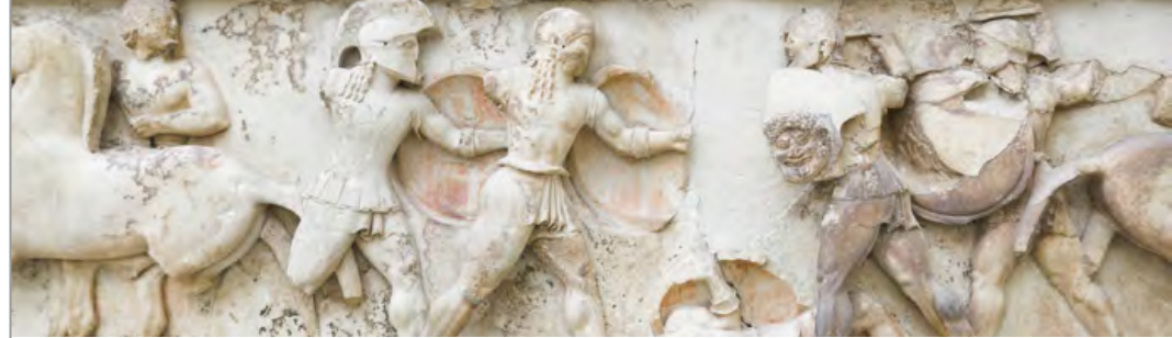
Relief in Delphi